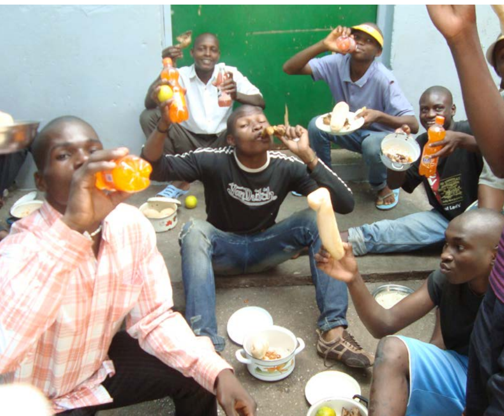
Les mineurs de la prison de Yaoundé lors d'un des rares repas de fête.

Certains ont même réussi à obtenir un bac en prison et plus tard un master à l'université.