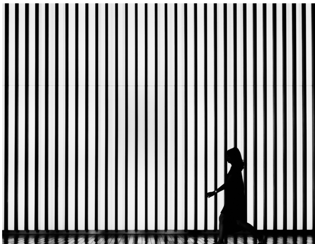
Prisons suisses : les problèmes en matière de droits humains sont multiples et particulièrement inquiétants.

Alors qu'il n'existe aucune donnée scientifique fiable au sujet de l'exactitude des diagnostics de dangerosité pour les délinquants condamnés, de plus en plus de personnes sont enfermées à titre préventif dans le cadre du « petit internement ». Celui-ci se prolonge généralement bien au-delà de la condamnation de base et peut être ordonné indépendamment de la gravité du délit commis.